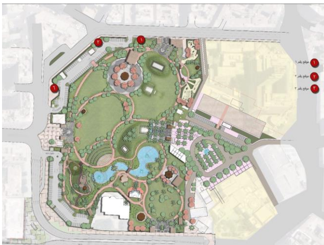
اسكتش يوضح الاماكن المقترحة لتوزيع الاكشاك بالموقع العام