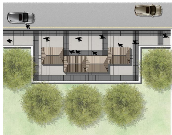
اسكتش يوضح اماكن توزيع الاكشاك بجانب بعضها